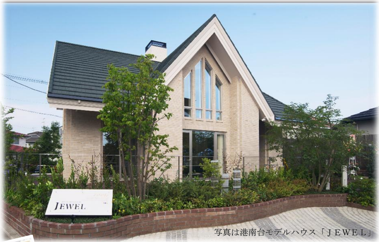
写真は港南台モデルハウス「JEWEL」